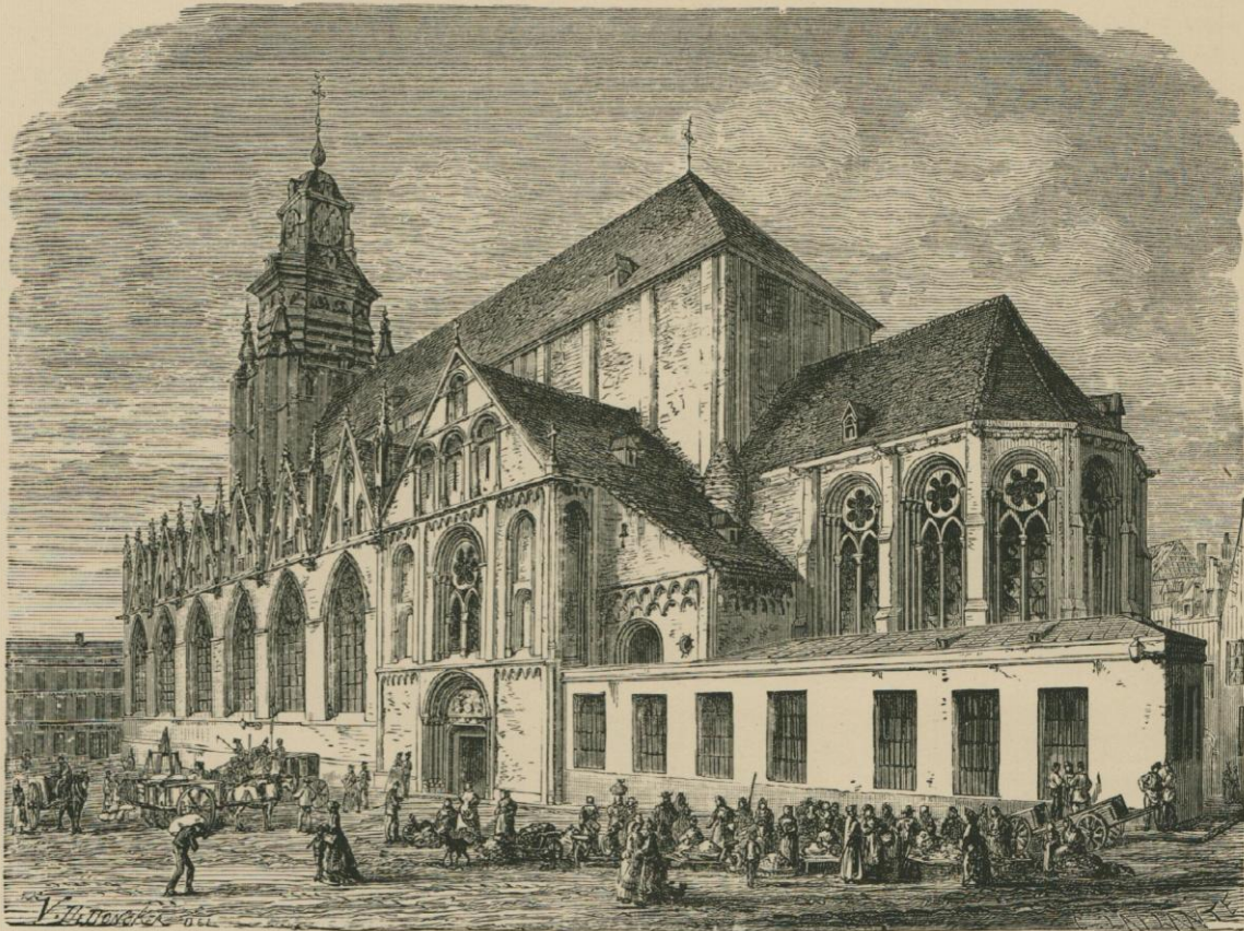
L'ÉGLISE DE NOTRE-DAME DE LA CHAPELLE. Dessin original de Victor De Doncker.

Puis il y a une autre couche, au-dessus de celle-là, logée, elle, dans les vieilles boutiques centenaires, aux senteurs rancies, classe probe, loyale et active, qui recèle, sous les dehors incultes d'un parler vulgaire, de profondes vertus de cœur et qualités d'esprit, un grand fonds d'honnêteté et de sens.